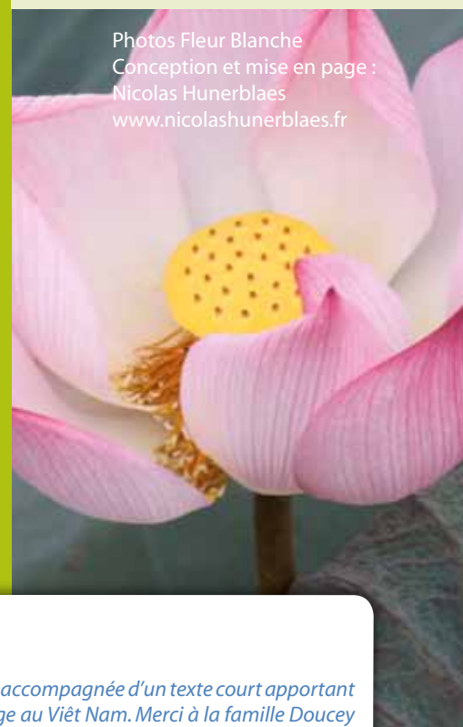
Conception et mise en page : Nicolas Hunerblaes www.nicolashunerblaes.fr