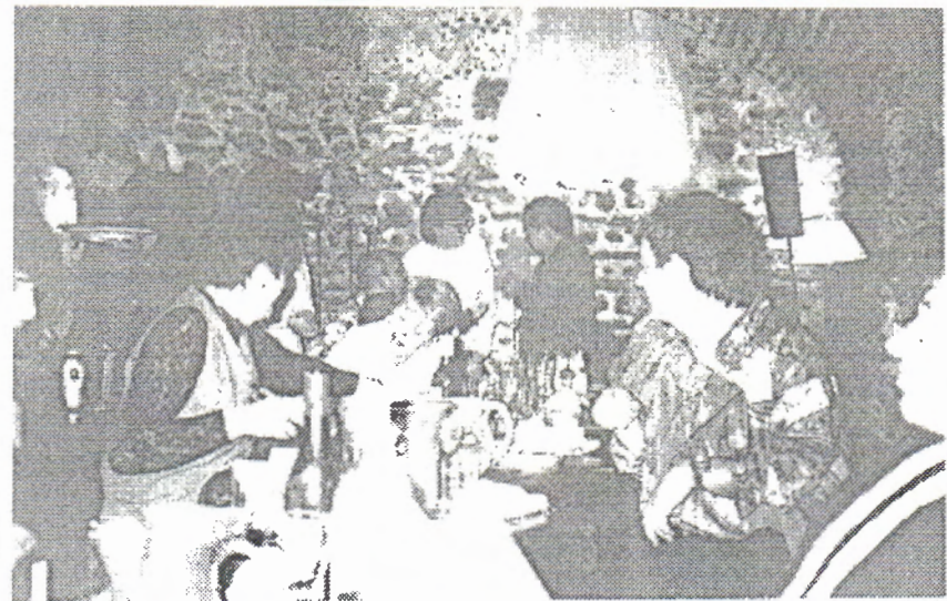
Au menu, bonne humeur et amitié assurées.