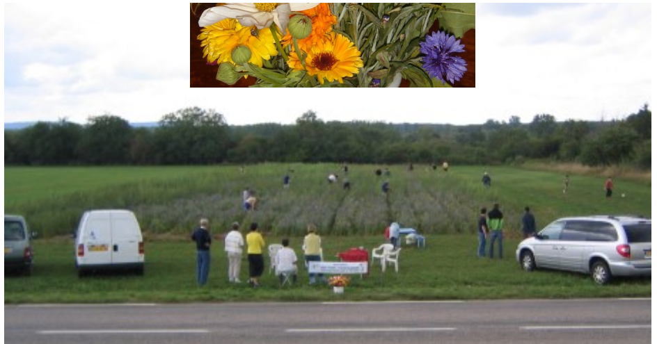
Fleurs de toutes les couleurs : une 1 ère réussite ↑