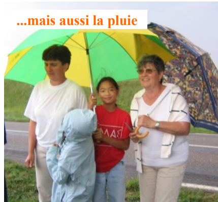
...mais aussi la pluie