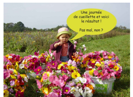
Une journée de cueillette et voici le résultat ! Pas mal, non ?