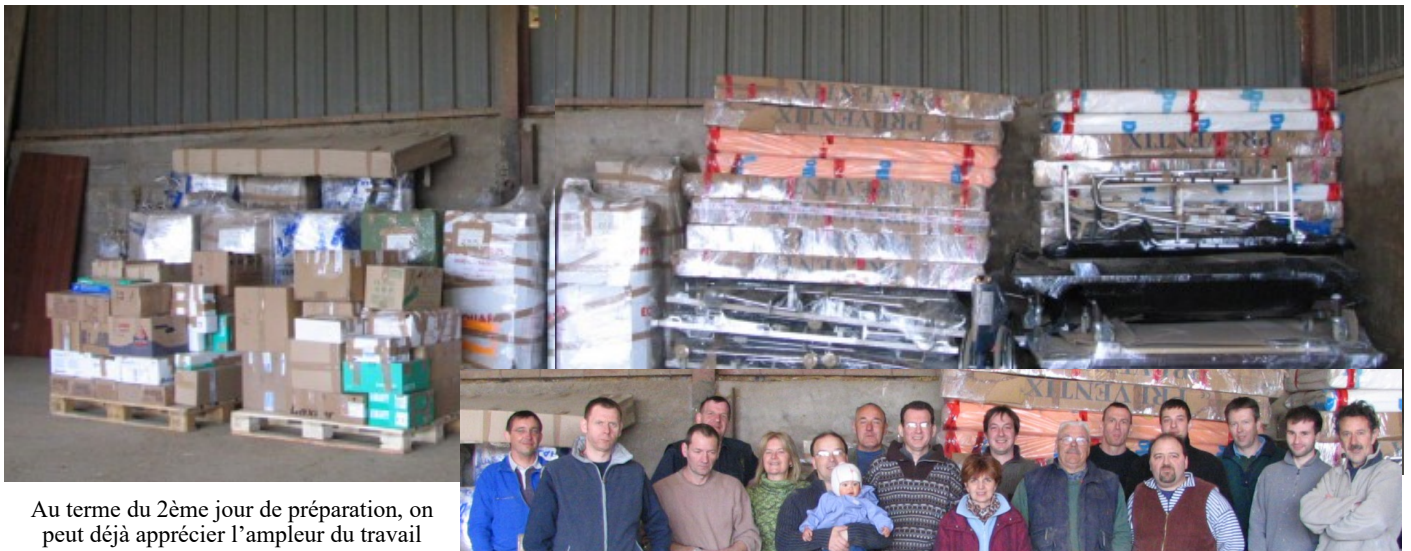
Au terme du 2 ème jour de préparation, on peut déjà apprécier l'ampleur du travail

Conteneur 2006 : 4 journées de préparation, 1 mois de mer et début septembre à Haiphong, 10 récipiendaires heureux !