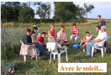
Avec le soleil...