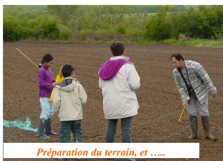
Préparation du terrain, et ....

Le 3 septembre, enfin, pour la dernière journée, le soleil est de retour et cette récolte après la rentrée scolaire est encore un franc succès. Toutes les fleurs ont