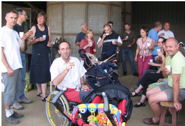
En fin de journée, ce 25 juin, épouses et enfants sont venus rejoindre les « chargeurs réunis » pour une barbecue géant.