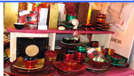
Les nouveautés, le moderne, les classiques, les stocks sont là