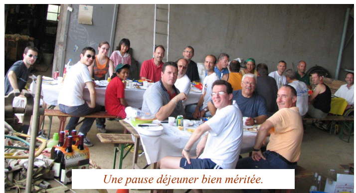
Une pause déjeuner bien méritée.