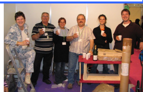
Mais déjà, on remballage ! Une folle ambiance, du début à la fin, aussi n'hésitez pas à nous rejoindre à l'édition 2006