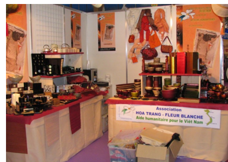
Très vite, notre équipe prend ses marques et nous voilà avec un stand ...m a g n i f i q u e