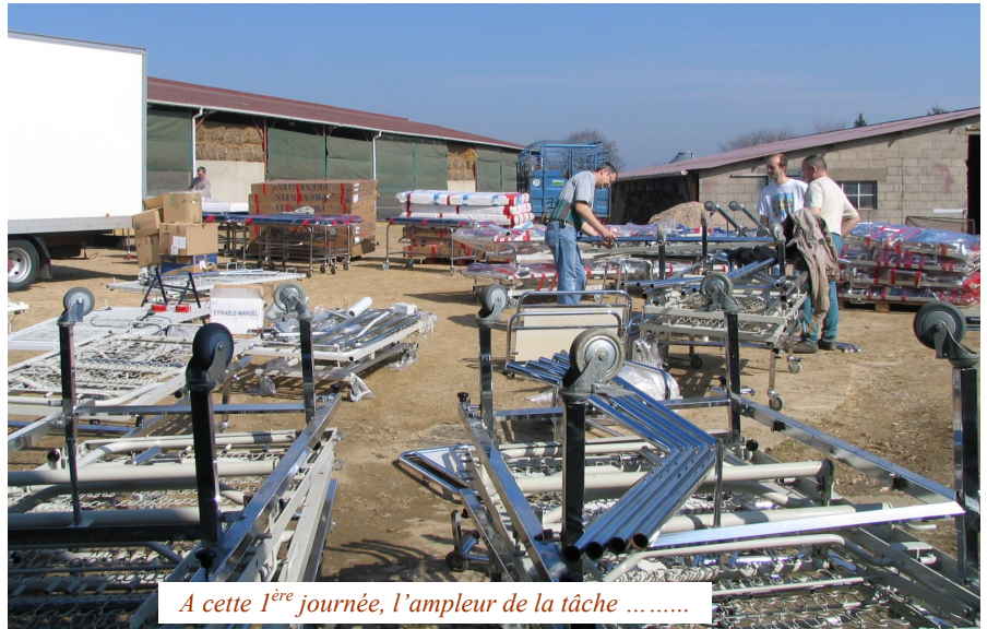
A cette 1 ère journée, l'ampleur de la tâche .....