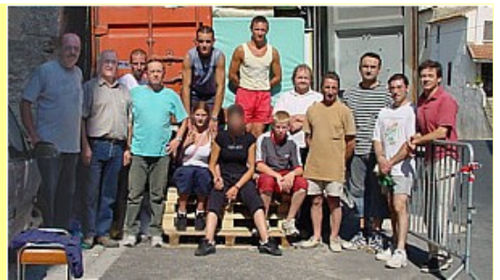
Chargement du conteneur de 40 pieds (66 m3) début juillet 2005 : direction Fos-Sur-Mer puis Haiphong.