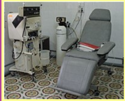
Ph. G. : L'un des 5 postes d'hémodialyse envoyés.

d'hémodialyse perturbé son fonctionnement et peu même entraîner son dysfonctionnement. Des alarmes retentissent alors et interdisent catégoriquement son usage. ATEM a formé cette équipe technique afin qu'elle soit aguérie au maximum face à de tels événements. Toutes les éventualités ont été vues, mais un complément d'informations sera transmis par Internet. Nous sommes en liens directs avec les équipes vietnamiennes médicales ou techniques, en place dans cet hôpital. Nous sommes très fier du fort dynamisme des équipes médicales, pharmaceutiques et techniques vietnamiennes qui ont collaborées à la réussite de ce beau projet. Elles ont toutes fait preuve d'une grande volonté d'apprentissage, d'un professionnalisme exemplaire. Les séances de dialyse se passent dans d'excellentes conditions, identiques à celles pratiquées en France. Ces cinq postes d'hémodialyse pourront à présent traiter sur place, 30 patients par semaine. Ils auraient dû parcourir plus de 240 Km (aller/retour) pour recevoir ce traitement vers la capitale.