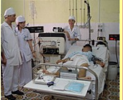
Merci à ATEM pour les textes et les photos.